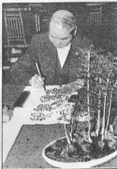
道之性養情怡的他是，字寫筆提時暇↑ 錦王的座寶軍冠賽徑田齡高界世上登度五第←

此外，他的健康之道還包括中國的哲學修養：安份守己，清心寡慾。他也強調運動的重要，這些年來