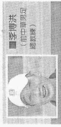
李弘斌 (前中華男足 總教練)

巴1:0勝 巴西、智利都是南美洲球隊，彼此的熟悉度很高；巴西要贏球需一番功夫，且有可能被對方逼入延長賽。