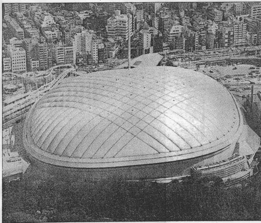
↑東京巨人棒球隊的室內球場「巨蛋」，可容納5萬多觀眾，不僅舉辦棒球賽，也常舉行藝文活動。

數十年來，台北市已暴露了無數因缺乏大型標準場館而造成的窘態，十多年來，台北市也蓋了無數空中樓閣。民眾不怕等，就怕等不到。