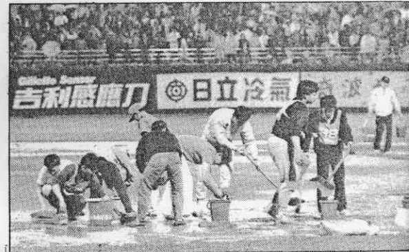
↑職棒冠軍戰因下雨積水，比賽暫停，工作人員進場吸水，比賽延誤了一小時。