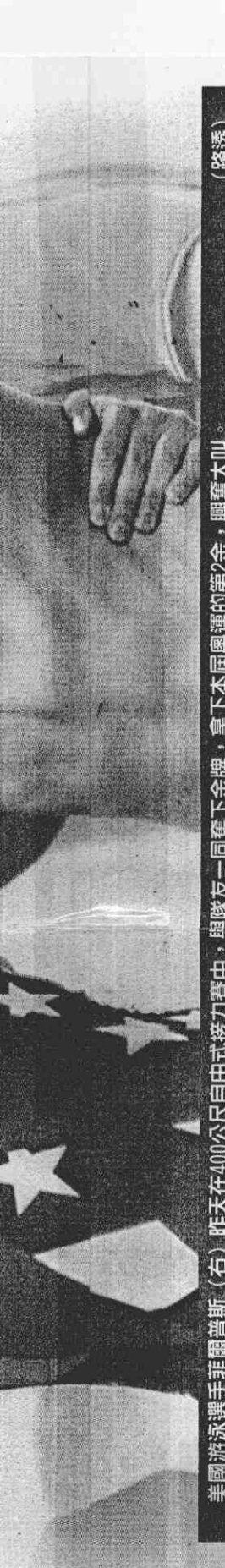
美國游泳選手菲爾普斯(右)昨天在400公尺自由式接力賽中，與隊友一同奪下金牌，拿下本屆奧運的第2金，興奮大叫。