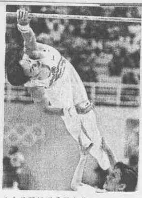
◀大陸體操選手楊威第五輪單槓發生致命失誤，錯失雅典奧運男子全能金牌。

●鞍馬9.725、吊環9.737、跳馬9.512、雙槓9.800，四輪後，38.774分，大陸楊威生涯首面男子體操全能金牌眼看到手，卻在第五輪的單槓脫手、掉落。悲情楊威在雅典奧運連「千年老二」的帽子都戴不上，大陸體操也繼續陷溺在「零牌噩夢」中。 作為大陸體操男子全能第三代傳人，楊威一直是大陸體操有名的「悲情人物」，雪梨奧運前1999年世界錦標賽、雅典奧運前2003年世錦賽，楊威都是男子全能亞軍，被戲稱為「千年老二」。兩屆奧運他都是全能金牌的熱門人選。但是，在雪梨，他敗給了俄羅斯尼莫夫，在雅典，他敗給了自己。