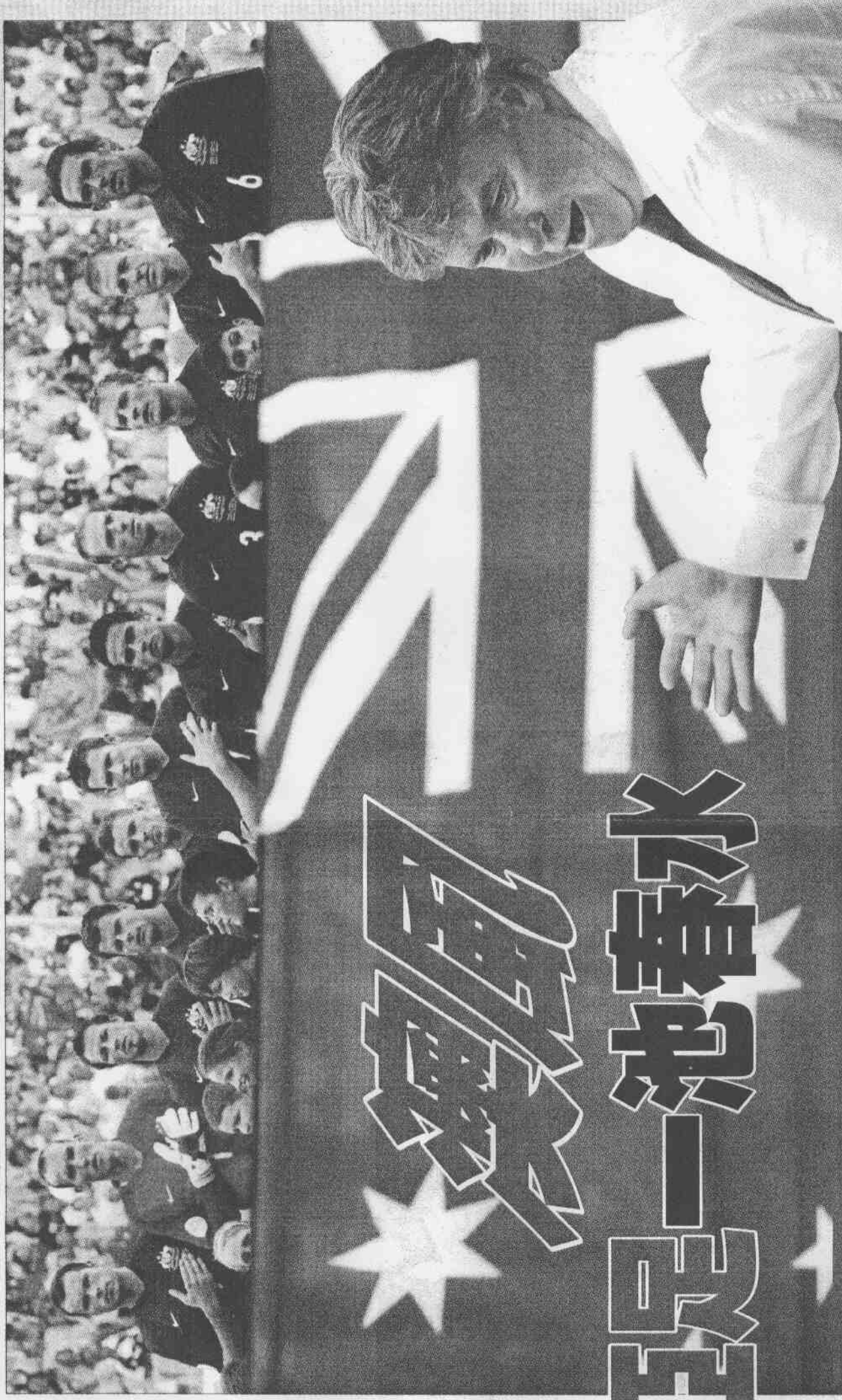
▼澳洲國家隊18日出戰巴西前唱國歌時留影。

杯會外賽中共有267個進球，在世界杯會外賽總進球數中排名第二，僅次於墨西哥，而且澳洲還有以31:0擊敗對手的懸殊紀錄。這些數據不足以證明澳洲的實力有多強或水準有多高，但足以說明與大洋洲對手的實力差距有多大。