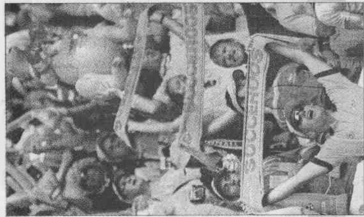
▲澳洲球迷高舉著澳洲隊的標誌。因澳洲和巴西國家隊都喜歡黃色，所以18日澳洲出戰巴西時，球迷幾乎滿場都穿著黃衣。 ▼不用猜也知道這個球迷在支持那一隊。

國際足總在世界杯賽前要求32隊的隊職員，簽下不參與下注賭球的切結書。國際足總紀律委員會，展開調查之後，昨天發表以上的聲明。國際足總表示，國際足總禁止球員下注，任何相關案件都會徹底調查。