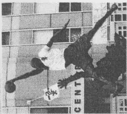
↑白襪隊隊拿 到世界大 冠軍，喬 丹的雕像 也穿上白 球衣。