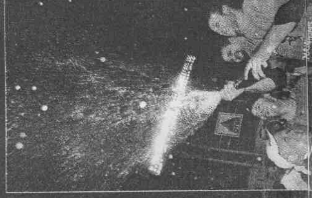
→贏得世界大賽冠軍，白襪投手布埃列開香檳慶祝