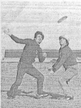
。(左) 礎基的式花是盤旋(右) 鍵關勝致是契默手選