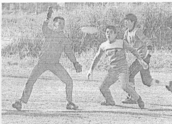
(攝明壽楊 者記報本) 應反間瞬手選驗考賽氣勇