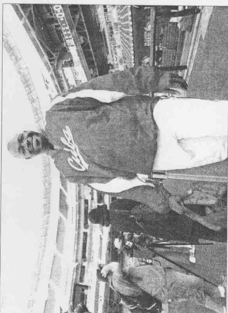
▲難得踏上美國本土的古巴棒球隊，昨天在加州聖地哥哥練球前留影，以示到此一遊。古巴

投票結果顯示，很多球迷都挺鋒仔，高達82%。共116739人投給鋒仔第1場就「發轟」的選項，百分比遠遠超過其他4個選項。認為鋒仔第2場轟全壘打的佔4%、第3場佔5%、第4場