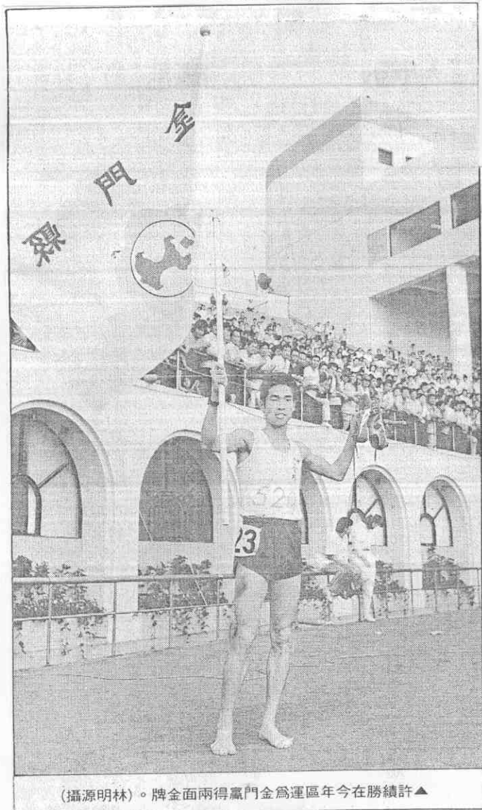
(攝源明林)。牌金面兩得贏門金為運區年今在勝績許▲