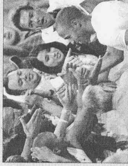
▲法國前鋒亨利（右）在法國打進世界杯冠軍決賽後，快樂的和球迷握手致意。 ▼法國球迷把特大版的國家隊球衣，展開在觀眾席，為法國打進冠軍戰助威。

世界杯冠軍戰將在柏林開打，這場比賽的門票黑市價格已經飆到原價的十倍，高達1500歐元。決賽的門票目前飆漲到1500歐元（1900美元）。四強準決賽開賽前的票價不過兩張600歐元而已。票商指出，開戰當天票價就會暴跌到一張600歐元左右。 國際足球總試圖印上購票者的姓名，以防黑市交易，不過票商們表示，由於每場球賽動輒數萬人進場觀戰，這種做法根本派不上用場，使驗票變得不可可能。