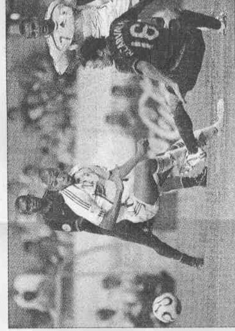
▲葡萄牙後衛卡巴奧（前右）用左腳勾到法國前鋒亨利（前左）的腳，被判罰12碼，成為決定勝負的關鍵。