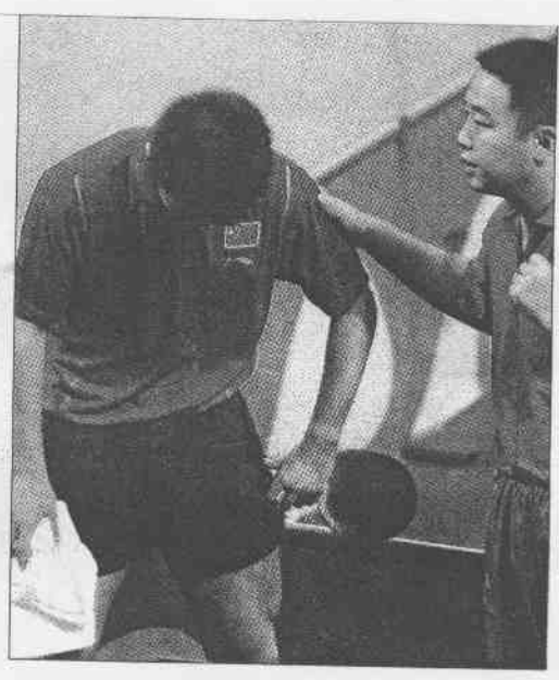
▲奧運桌球男單金牌戰，大陸選手王皓（左）痛失金牌後，神情落寞。