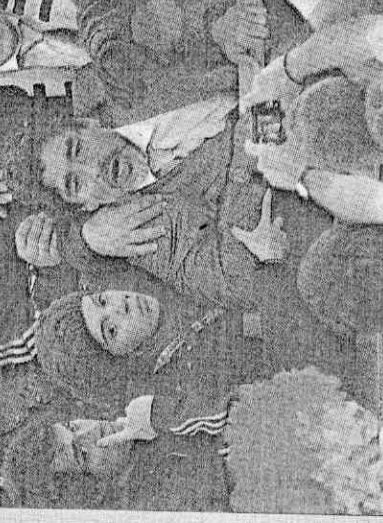
阿根廷教頭馬拉度納(右)與德國球迷爭執，女兒在旁要老馬冷靜別衝動。

克洛澤追平德國傳奇球星蓋德·穆勒十四球，謙虛說前輩只用兩個辦到，他則已經踢第三屆。 克洛澤認為現在球隊進入四強，達成賽前預定目標，只剩兩場比賽，目標當然只有一個，「我想贏球，不是想進球了，我想再贏兩場比賽，贏得世界盃冠軍，這比任何事都重要。」 他將在四強戰與比利亞交鋒，他誇獎對手擁有像阿根廷梅西般腳法與速度，奉勸隊友們不能看輕比利亞，要像守梅西那樣，夾擊比利亞。 斯內德則因國際足總改判，把巴西梅洛烏龍球，改為他的進球，進球榜竄升至第二。 他坦言有點意外，這並非他的目標，史上尚未有荷蘭球員獲得金靴獎，不過荷蘭也是世界盃「無冕之王」，「我很矮小，可是我意志很強壯，目標很大，我們要拿下世界盃冠軍。」