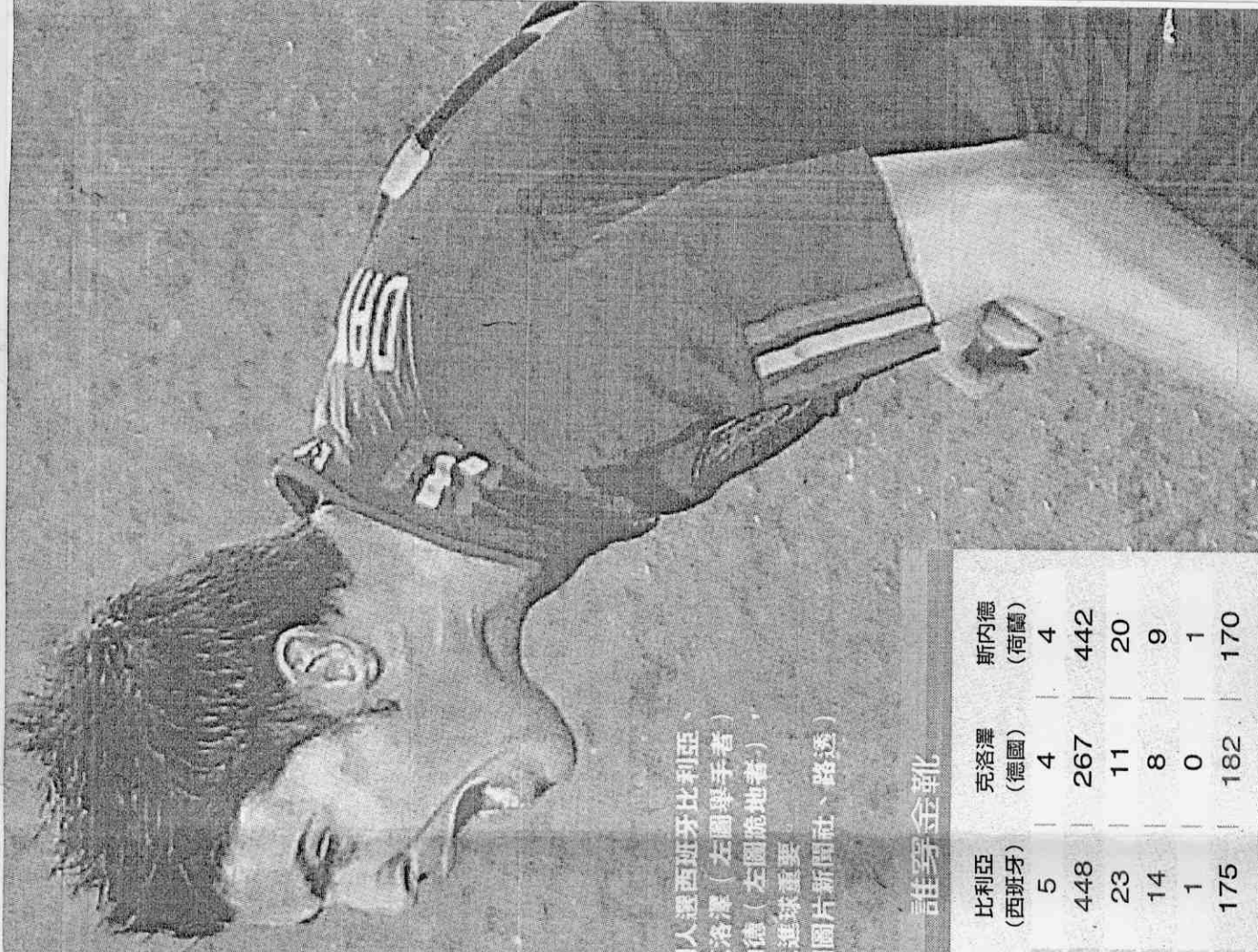
金靴熱門人選西班牙比利亞、德國老將克洛澤（左圖舉手者）與荷蘭斯內德（左圖跪地者），眼中勝利比進球重要。