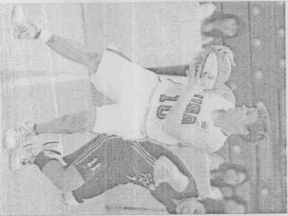
▲美國女籃選手妮可愛用刺青記錄生活點滴。