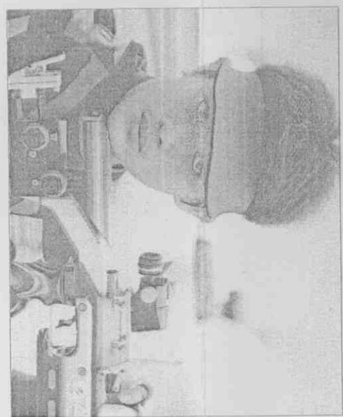
▲九十八與九十七分，六輪總分五八分過來安慰身旁親友。今年四月北京聽障射擊賽曾繳出五八〇高分，此次雖失利，但潛力十足，未來仍可望成大器。

許素惠／雲林報導 高雄主辦的世運獲得熱烈掌聲，聽奧主辦單位台北市府備感壓力。高雄市長陳菊六日面對媒體詢問對聽奧開幕法時強調「聽奧很精采，代表大家都有世運的成功經驗，全國都在看聽奧是否能延續世運的完美與精彩。陳菊給予高度肯定，頻說「很好！很精采！」此外，高雄電影節將邀展以孤獨《愛的十個條件》為背景的紀錄片，外界認為是她支持孤獨的反射，陳菊請大家不要過度解讀。 陳菊說，影片是高雄市府新闢處邀請專家細選的，她與團隊都尊重專業，請外界不要有過多聯想。