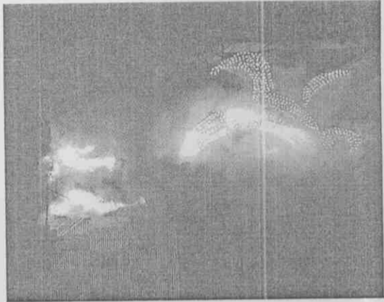
台北聽奧開幕式，大會LOGO焰火掉落引發火警，消防人員緊急滅火。

【記者林冠輝、曾文煥／台北報導】台北聽奧開幕式國旗歌演唱的台北愛樂合唱團，昨晚七點四十八分，當開幕大典進行到第二幕「曼德拉獻禮」鼓舞即將結束時，北側舞台突然起火燃燒，與會觀眾一度以為是舞台特效，直到消防人員趕到現場以滅水器、水柱滅火，才發現是聽奧LOGO燃燒焰火掉落，火勢延燒造成北側主舞台一度煙霧瀰漫。主辦單位台北市府表示，燃燒LOGO是預設效果，並非意外事件。聽奧媒體中心也澄清，這是節目特效一部分。參與開幕式國旗歌演唱的台北愛樂合唱團，昨晚七點四十八分，當開幕大典進行到第二幕「曼德拉獻禮」鼓舞即將結束時，北側舞台突然起火燃燒，與會觀眾一度以為是舞台特效，直到消防人員趕到現場以滅水器、水柱滅火，才發現是聽奧LOGO燃燒焰火掉落，火勢延燒造成北側主舞台一度煙霧瀰漫。主辦單位台北市府表示，燃燒LOGO是預設效果，並非意外事件。聽奧媒體中心也澄清，這是節目特效一部分。