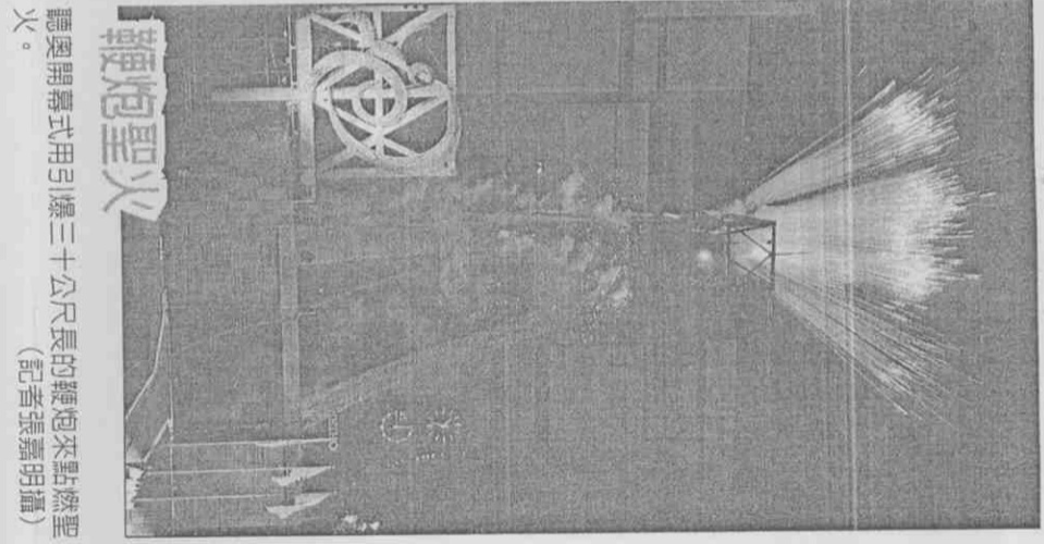
聽奧開幕式用引燃三十公尺長的鞭炮來點燃聖火。

【記者古明弘／台北報導】「阿妹」張惠妹登上聽奧舞台，心情是既緊張又亢奮，腎上腺素直線上升，不過，她在空中飛翔演唱聽奧主題曲「聽得見的夢想」，經過十多次的反覆彩排，在空中張開翅膀帶著全場，她經歷擔心、害怕到享受，現在還得了「飛行上癮症」，欲罷不能。受邀成為聽奧表演歌手，用歌聲對全世界「吸晴」，阿妹深感榮幸，但相對更謹慎，「台灣很少舉辦如此大型國際賽事，能受邀當然要謹慎。」她的經紀人陳鎮川透露，阿妹為自己三個小時的表演節目，光彩排就十多次，相當慎重。