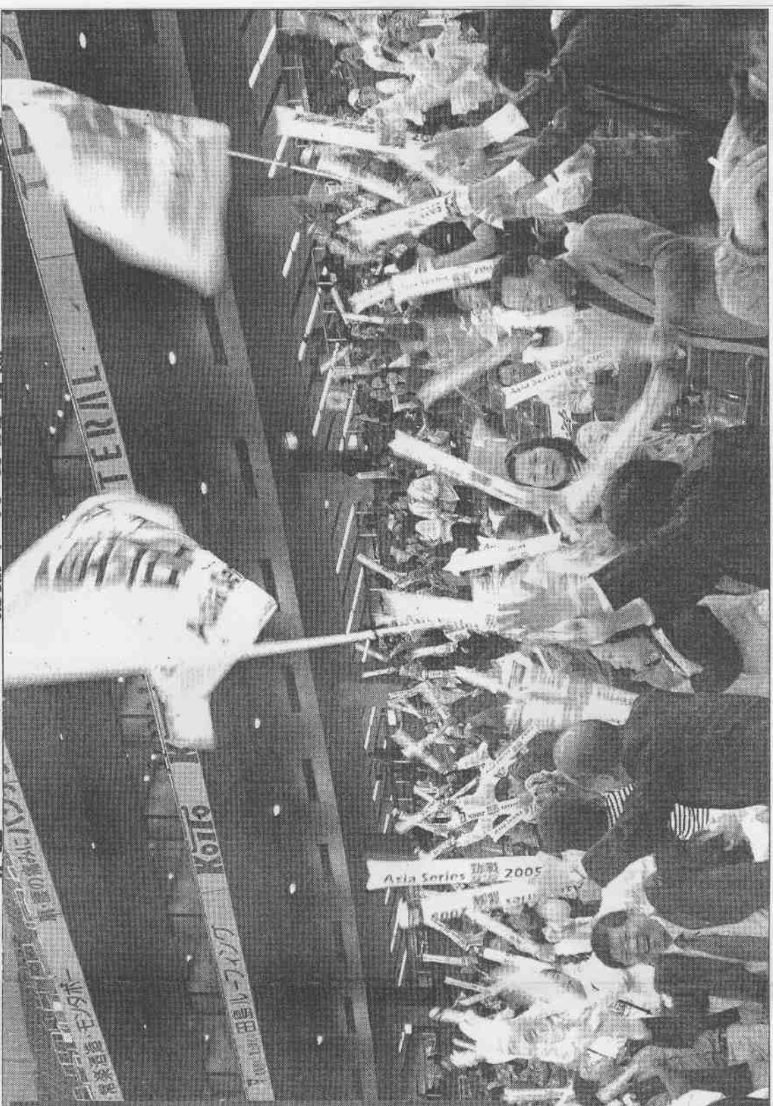
↓興農牛隊在亞洲職棒大賽首場比賽，起用洋將將戰五飛主投，果然不負眾望，終場興農牛隊以六比〇大勝中國隊。