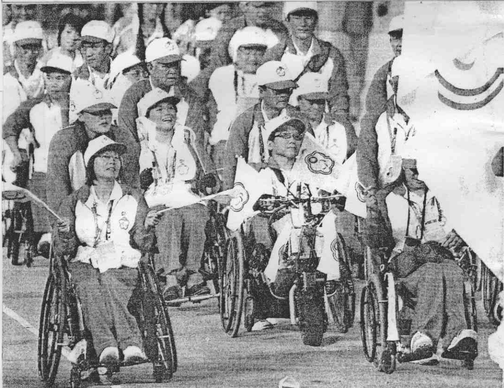
2008北京帕拉林匹克運動會昨晚開幕，我國代表隊在殘障運動總會會旗的帶領下，緩緩進場（上圖，美聯社）。身著5種顏色的表演者，揮舞雙臂向觀眾打招呼。（左圖，法新社）