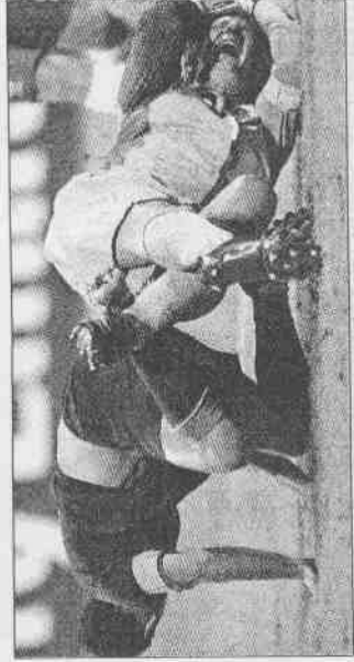
鏟倒 葡萄牙西莫(左)鏟倒後，荷蘭門將范德薩慘嗶倒地。

球，施瓦澤眼裡充滿了無奈。大清倉葡萄牙與荷蘭之戰的裁判伊凡諾夫昨天送出四張紅牌，分別送給葡萄牙的斯科拉、魯賓、德科、荷蘭的布隆克羅斯特、荷蘭的范德瓦、史內德在