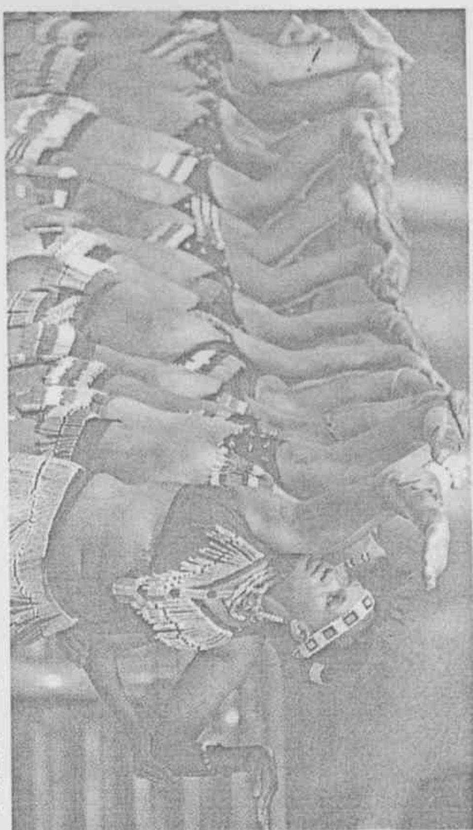
→在南非世足賽抽籤儀式結束後，現場表演了一段精彩的傳統舞蹈。

亞洲4隊堪稱清一色下下籤，日本身處「人人有機會、個個沒把握」的另一個「死亡之組」，南韓的出線機會