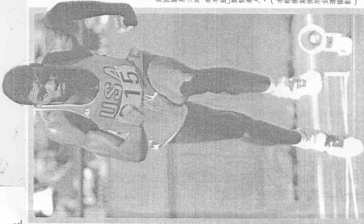
美國劉易士的「飛毛腿」聲勢奪人。

操體子女羅蘇 道柔韓日 尺公百子男加美 艇輕芬德 排男蘇美 網女阿德 泳男德美 蕾芭上水加美 賽籃女男蘇美 松拉馬吉日