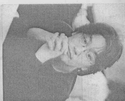
▲作曲家櫻井弘二。