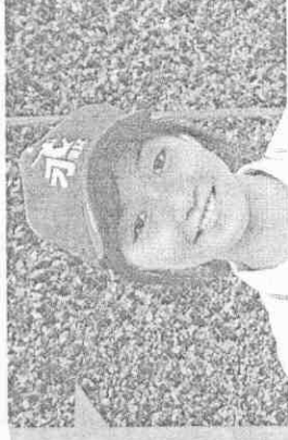
小A 21歲 高雄師範大學體育系四年級

這次永信杯是我第2次在大比賽當裁判，學到蠻多經驗，前2天都有被球員搭訕，有點不好意思。我主修的是田徑跨欄，可是比較常跳舞和打桌球，系上規定要考執照，我除了排球C級裁判資格，還有游泳教練與裁判資格喔！