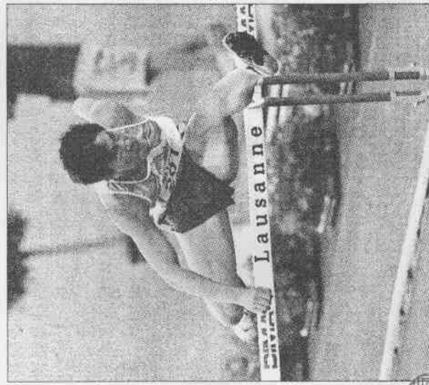
▲劉翔賽後興奮的在計時器前留影。