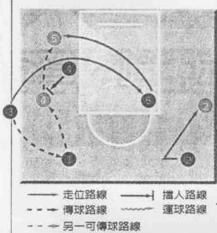
圖二：木狼隊的連續擋切進攻法