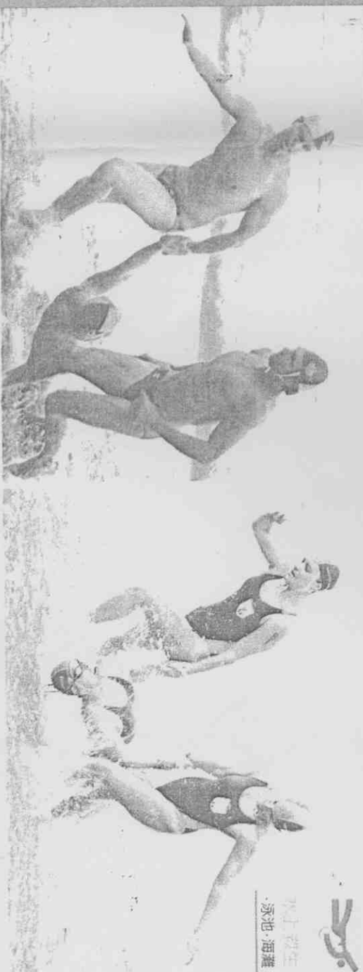
水上救生 泳池·海灘

↑世運水上救生競賽昨天在西子灣海灘舉行各項目的決賽，左圖為男子救生帶團體賽，兩位隊友將弱者拉上岸邊，由澳洲隊獲得金牌。右圖為女子救生帶團體賽，由南非隊獲得金牌。