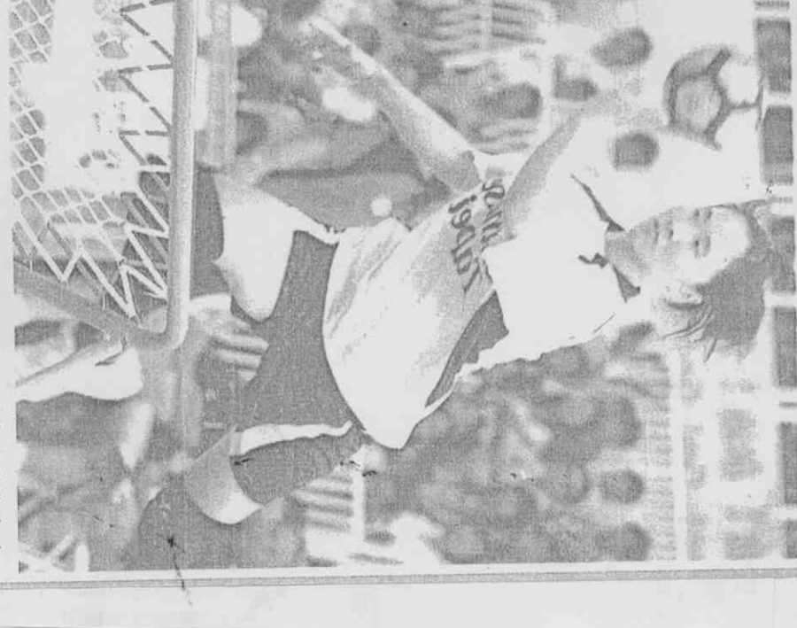
大，第一局結束比數已來到二十五比八。