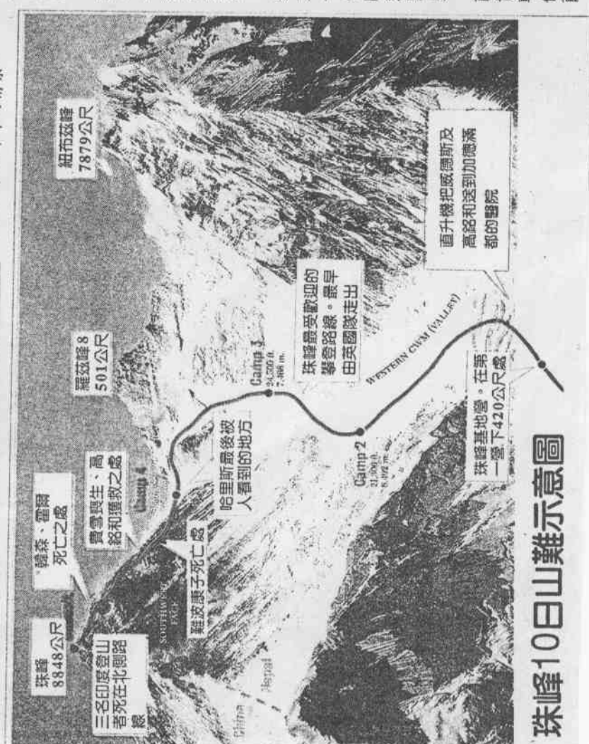
珠峰10日山難示意圖