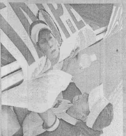
阿美粉絲眾多，贏球後立刻為大家簽名。