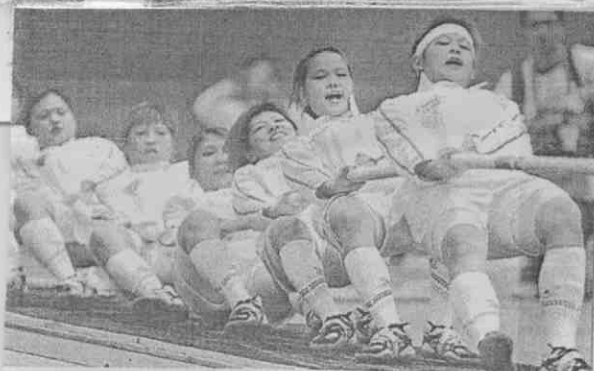
■我國女子拔河隊在上屆世運會稱后。

上屆德國杜易斯堡世運會，中國世運代表團僅35人參賽，共奪下4金5銀3銅，排名第12；今年高雄世運會，中國代表團人數倍增至77人，將參加蹼泳、滑水、水上救生、運動攀登、健美、飛行運動、彈翻床、滾球和武術共9種類比賽，在這9個種類競賽中都有奪牌的實力。