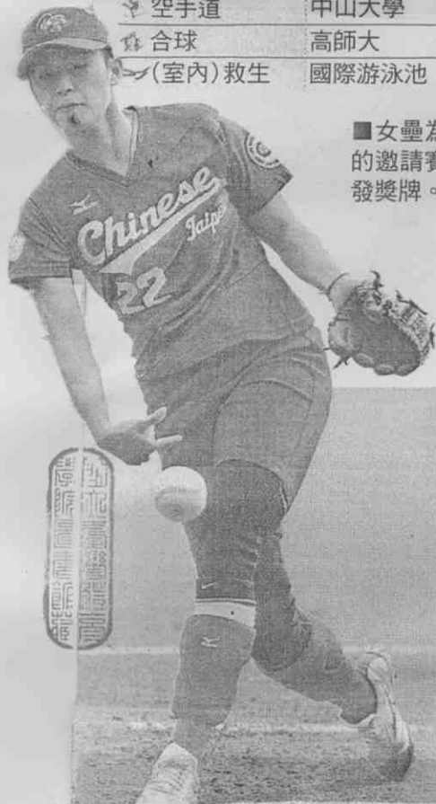
■女壘為此次世運會的邀請賽項目，不頒發獎牌。資料照片