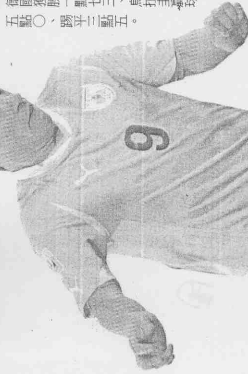
► 烏拉圭前鋒蘇亞雷斯歸隊。

廖德修／綜合報導 南非世界盃季軍戰德國對烏拉圭台北時間明天凌晨二時卅分登場。烏拉圭若勝，即為一九五〇年後隊史最佳成績，全隊鬥志高昂。德國上屆就是季軍，兩屆都參賽的主將興趣不高。 克洛澤、穆勒等人為爭金靴獎，尤其克洛澤尋求世界盃進球紀錄，反而成了重點。他累計已進十四球，只差前巴西名將羅納度一球。 烏拉圭參加一九五四、七〇年世界盃季軍戰均敗，七〇年是以〇比一輸西德。德國參加過一九三四、五八、七〇與〇六年世界盃季軍戰，僅五八年落敗。另外，六六年世界盃八強賽西德四比〇勝烏拉圭，八六年小組賽雙方一比一踢平。世界盃史上德、烏對陣三次，德兩勝一和；加其他賽事，德國六勝二和保持不敗。 從德、烏歷史數據來看德國占上風，但巨爾曼坦克被鬥牛士頂翻後，主力球員都很難過！克洛澤聲稱，暫無心情爭金靴與尋求世界盃進球紀錄，當然也因背傷的緣故。其實這可能是他的世界盃最後一戰，果真放棄就太可惜了！ 其他主力如厄齊爾、凱迪拉亦有傷，教練團將派替補球員奧戈、塔斯齊與二號門將維澤出賽。他們急於秀自己，加上禁賽復出的穆勒有爭金靴的希望，勢必全力以赴，新組合可望產生效果。德國新總統伍爾夫將到場觀戰，或可鼓舞軍心。 至於烏拉圭以南美第五名打到季軍戰已大受激賞！若能拿季軍，更是近六十年最佳成績。不僅佛蘭有爭金靴希望，將奮力一搏；準決賽未上陣的蘇亞雷斯、富西來（均禁賽）與隊長盧加諾（受傷）也都歸隊。難怪老教頭塔巴雷斯喧聲：「拚到最後一分鐘也要拿季軍！」 論實力，德優於烏；拚士氣，烏高於德。論獎金，季軍兩千萬美元，殿軍二千八百萬，德國球員已有十萬歐元進帳，拚個人獎與創紀錄反而較有意義。國際博彩網站威廉希爾開出的賠率是：德國獲勝一點七三、烏拉圭贏球五點〇、踢平三點五。