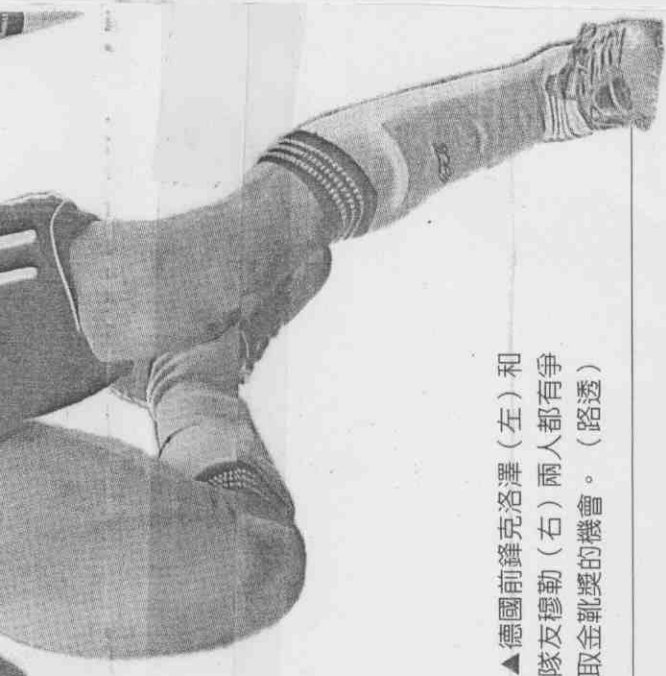
▲德國前鋒克洛澤(左)和隊友穆勒(右)兩人都有爭取金靴獎的機會。