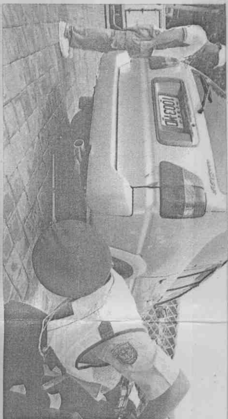
▲警方拿著車底反射鏡，對車輛進行全面安檢。