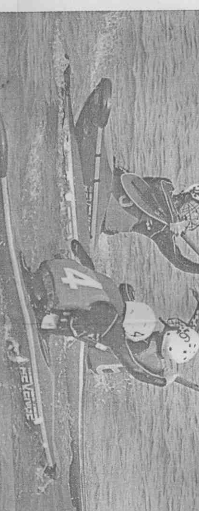
▲中華輕艇水球隊在蓮池潭備戰這項新奇的運動，希望爭取好成績。