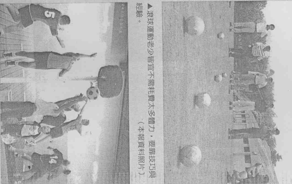
▲滾球運動老少皆宜不需耗費太多體力，要靠技巧與經驗。