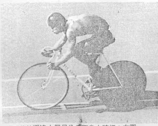
錄紀國全破打逐追體團尺公千四：左圖。手選進文林縣花的逐追人個尺公千四會大破打：右圖（攝組小影攝運區報本）。隊縣中台的