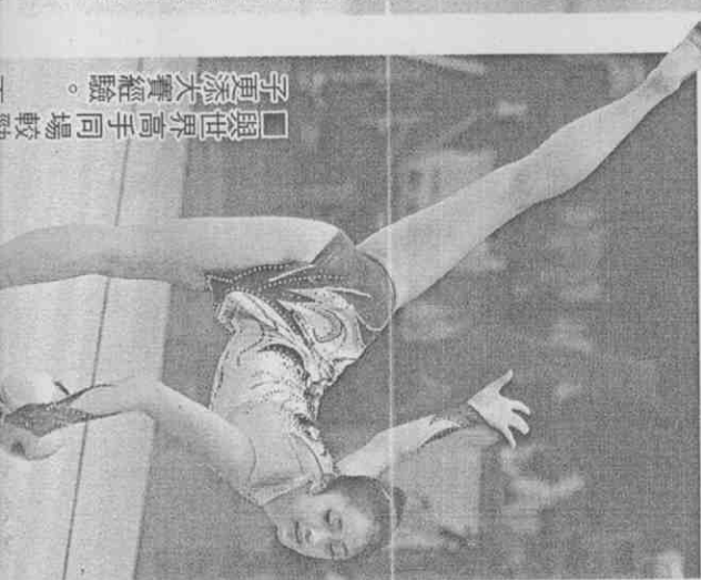
■與世界高手同場較子更添大賽經驗。