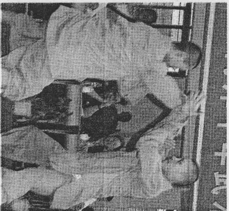
參加兩岸傳統武術大賽的臺灣各地團隊，包括中國文化大學國術系、臺灣體育大學、武術散打協會等三十六個知名團體組隊參賽，規模盛大。