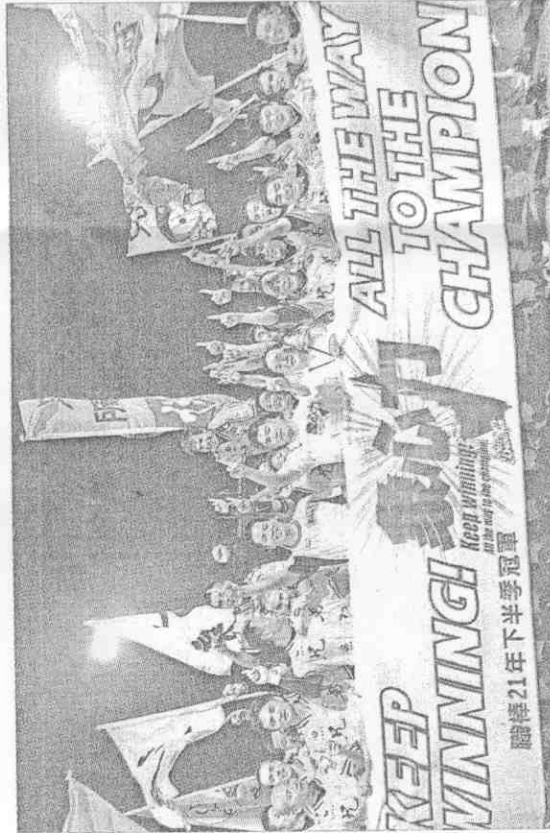
▲兄弟象球員在下半季冠軍旗前慶祝勝利。