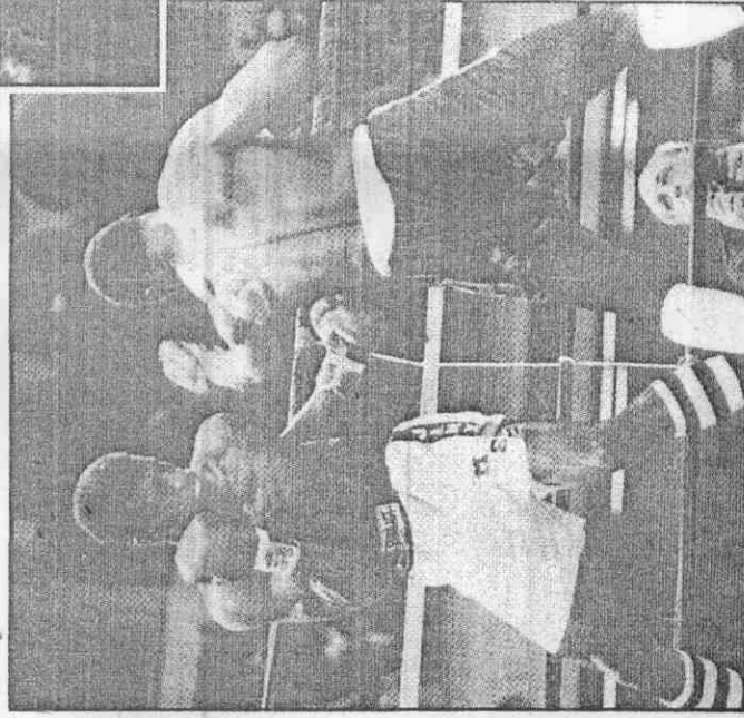
史賓克(左)擊敗布雷頓奪得世界輕重量級拳王頭銜。