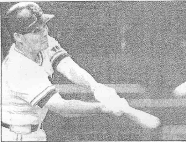
▶呂明賜揮出的巨棒，震驚日本職棒壇。