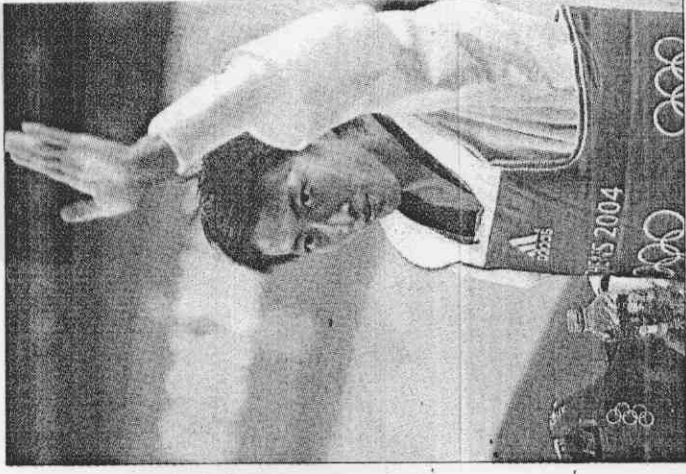
朱木炎冷靜，在國際跆拳道賽場創佳績。

這就是朱木炎，結合「戰神」勇猛依舊、再融合太極而成的「變形金剛」，也是他在奧運衛冕的秘密武器。