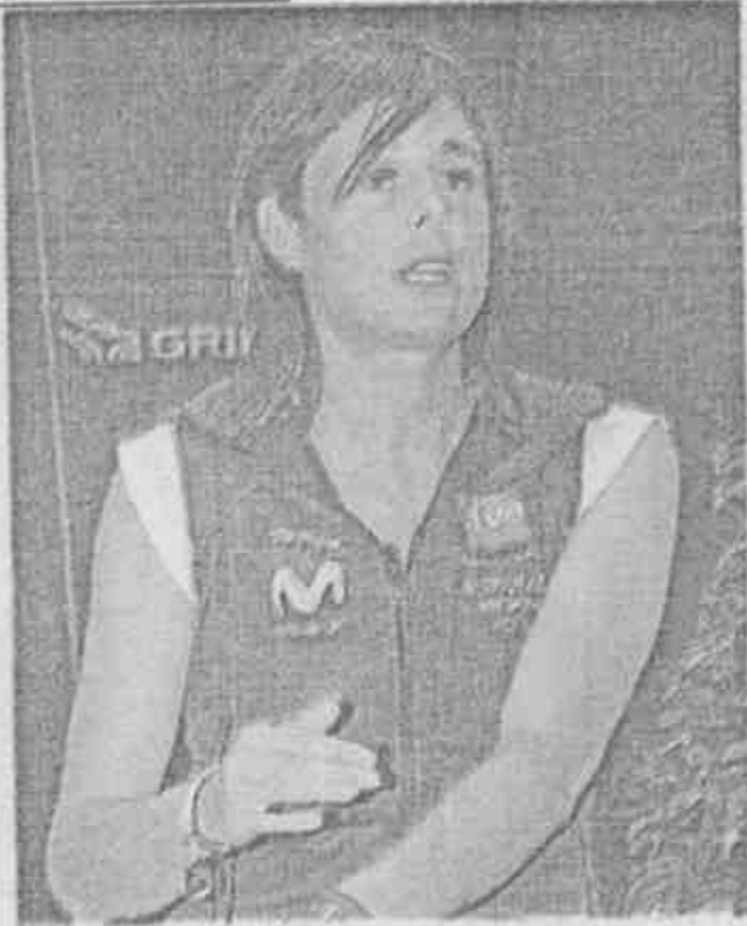
▲帕莎班已征服十三座八千公尺以上高峰。

誰能成為第一位征服全球十四座八千公尺以上高峰的女性？這場爭霸戰已日趨白熱化。卅六歲的西班牙女將帕莎班（Edurne Pasaban），十七日完成第十三座、標高八千零九十一公尺的安納普爾納峰，正式宣告進入聽牌階段，只要再挑戰希夏邦馬峰成功，將成為第一位締造此壯舉的登山女傑。