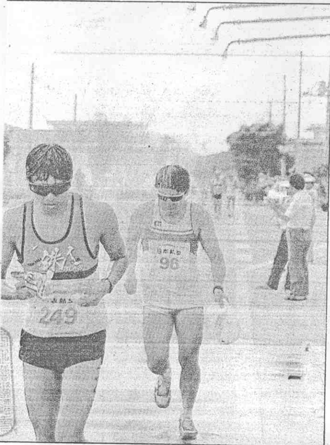
▲馬拉松賽途中，設有多處讓選手淋浴驅熱的自來水蓮蓬頭，只要有選手經過，水就噴出來，涼快涼快。