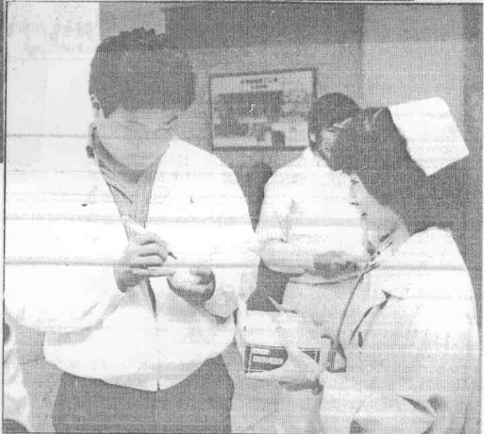
△在們她為，現發姐小士護被(左)強士趙的賜明呂弟學望探總榮到△。名簽上球棒