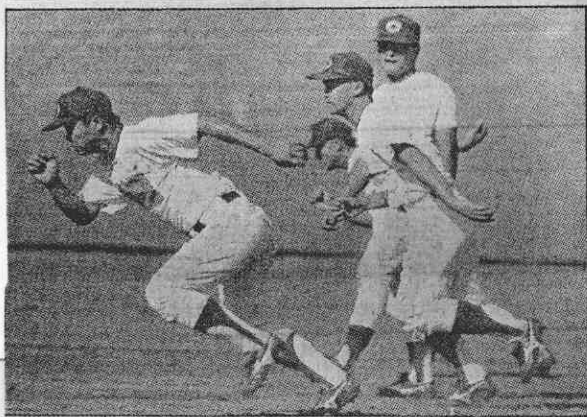
↑中華隊在對韓之前強化跑壘訓練。