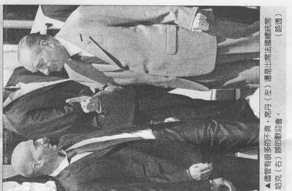
▲儘管有很多的不爽，席丹（左）還是出席法國總統希拉克（右）辦的歡迎會。

吳清和、楊俊斌／綜合報導 被激為狗而失控的席丹，帶著生涯的第十三張紅牌告別足球場，席丹是一九七二年六月廿三日生的巨蟹座，但他的性格卻像是提前幾天出生的雙子座孩子，是天使也是魔鬼。高超的技術是他天使的一面，而在球場會有暴力則是他魔鬼的一面。 席丹的恩師，法國戛納隊的球探瓦勞德了解席丹甚深，他說，席丹這個內向的孩子心靈深處有著本能的膽怯，但釋放心中壓力的方法卻常出人意料。有一次早上，瓦勞德走進體育場，發現小席丹在掃地，原因是他在比賽中打了屢次侵犯他的傢伙，少年隊的教練於是罰他掃三個星期的地作為懲罰。瓦勞德教他解怒的辦法是把球踢得再漂亮些，把球帶得讓人更拿不到。席丹的確做到了，但暴怒卻每隔一段時間就要發作一次。 席丹從九二年在法甲球隊波爾多效力，當時他已經當上了球隊主力，對方的特別照顧也跟著多起來，年輕氣盛的席丹有時會忍不住報復對方。在波爾多的四年中，席丹開始有了紅牌，三張。 從九六年中，席丹轉會至意甲的尤文特斯，成了世界級球星，五年裡他幫助球隊二奪意甲冠軍，但隨之而來的是對方會特別派二至三名後衛來招呼他，被粗魯動作搞到人仰馬翻的席丹終於壓抑不住脾氣，在為尤文特斯效力的這五年中，他一共領到五張紅牌。