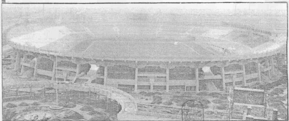
。臨來運區的五廿接迎備準，成完致大場育體正中市雄高