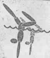
◀美國隊在水上芭蕾規定動作演出完美，排名第一。