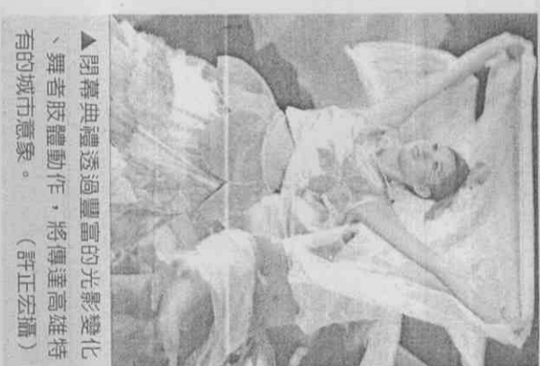
▲閉幕典禮透過豐富的光影變化、舞者肢體動作，將傳達高雄特有的城市意象。

以閉幕式的創意度來說，高雄世運的閉幕很有新意：以在地民眾的參與度而論，高雄世運的閉幕式熱度猶如豔陽下的白晝。