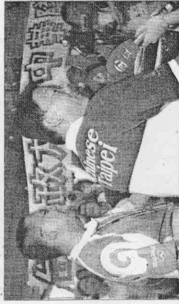
▲中華台北棒球代表隊抵達北京，來自台灣的學生加油團特別赴機場迎接球隊。