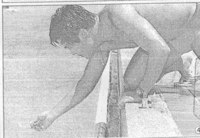
①游泳旺季的夏天，水質衛生問題，有誰關心？②救生員在水中清掃游泳的瓷磚。③游泳池像個大澡缸，衛生嗎？④泳池管理員每天以藥劑測驗酸鹼值。⑤測驗酸鹼值的容器和藥劑。

【台南訊】夏季的游泳池人滿為患，水質衛生嗎？衛生局入夏以來只檢查一次，且只是針對名冊上列管的六家，愛好游泳的民眾，希望衛生局加強檢驗。