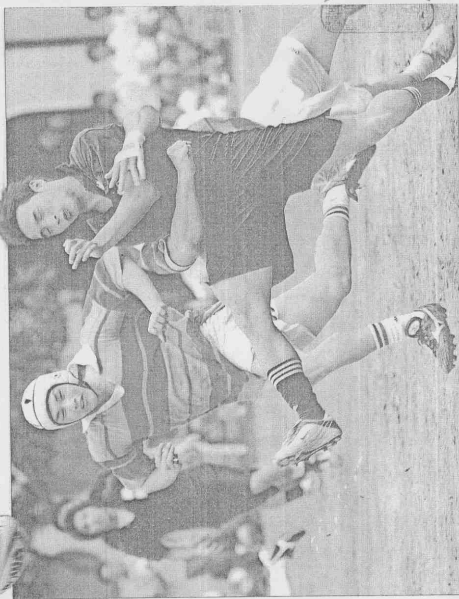
▲2004年北市建國中學、淡江中學兩所學校舉行「百年名校橄欖球對抗賽」，青壯組比賽都是國內現役頂尖好手，比賽節奏明快。

橄欖球運動向來追求團隊精神，不論刮風下雨，選手在泥濘中拚戰的畫面令人動容，學長學弟制更是重要傳統。日治時期巨星柯子彰及建中「黑衫軍」、淡江中學、長榮中學橄欖球隊的身影，都已在這項運動留下難以磨滅的身影。