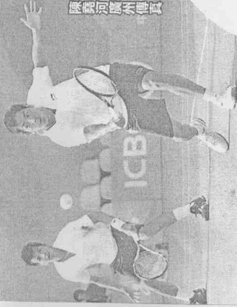
■胖寶配決勝點固守金牌。