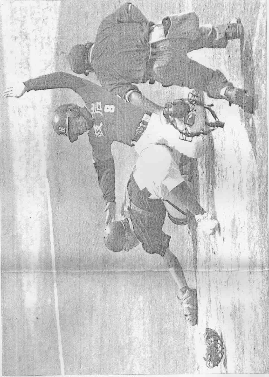
流淚播種，才能歡呼收割

20年來，中華職棒即使勉強算是一輛火車頭，但輸出到基層的動力總是斷斷續續或有氣無力，整個棒運發展也跟著走走停停，前進的里程數很有限。今年體委會提供職棒諸多資源，目的就是希望這輛火車頭重新上路，扮演好自己的角色。